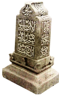
Gambar 1. Batu Nisan di Kampung Permatang Pasir, Pulau Tambun, Pekan bertariikh 419 Hijrah bersamaan 1028 Masihi.

orang Arab ini telah menetap di Pahang khususnya di Pekan sebelum abad ke 15, iaitu sebelum terbentuknya Kesultanan Melayu Melaka. Hal ini kerana menurut beliau terdapat banyak makam Syed yang terdapat di Pekan. Malah sehingga hari ini masih terdapat perkampungan masyarakat Arab di Pekan yang didiami oleh waris-warisan masyarakat Arab ini secara turun-temurun. Menurut catatan dalam Sejarah Melayu, terdapat seorang bangsa Arab bergelar Nakhoda Saidi Ahmad dari Kampa yang tinggal di Kuala Pahang membantu Hang Nadim bagi melarikan Tun Teja untuk diserahkan kepada sultan Melaka, Sultan Mahmud Shah pada tahun 1494 (A. Samad Ahmad, 2000). Menurut Munsyi Abdullah (2005) dalam catatannya pula mengatakan bahawa terdapat beberapa keluarga Arab yang telah menetap di Kampung Maulana, Pekan, Pahang kira-kira dalam tahun 1838. Kesemua ini jelas menunjukkan bahawa komuniti Islam telah lama wujud di Pahang dan tidak mustahil ia merupakan antara faktor penggerak kepada penyebaran agama Islam di Pahang.