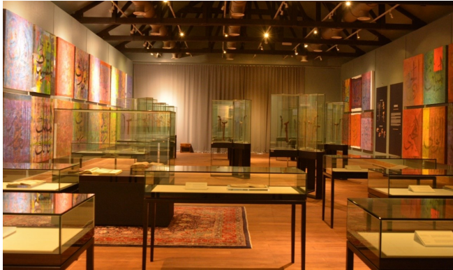
Gambar 5. Galeri Kehambaan di Muzium Sultan Abu Bakar, Pekan, Pahang

daripada diresapi dengan faham sekularisme penjajah. Bahkan dalam banyak keadaan ulama telah terlibat secara langsung dalam penentangan penjajah (Abdullah Zakaria, 2012). Hal ini boleh dilihat daripada usaha Tokku Paloh menyokong dan memberi suntikan semangat jihad kepada perjuangan Dato Bahaman (Amnah, Norshima, Wan Kamal & Izziah, 2014).