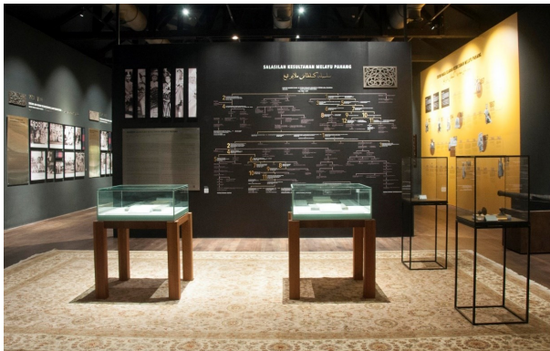
Gambar 3. Galeri Kesultanan Melayu Pahang - Daulat Tuanku di Muzium Sultan Abu Bakar, Pekan, Pahang

dengan agenda globalisasi seperti persamaan manusia, hak asasi manusia, hak individu dan pluralisme agama (Muhammad Kamal Hasan, 2001). Golongan ini mendapat dukungan kewangan dan media daripada badan antarabangsa, yang menjadikannya lebih efektif (Rahimin Affandi Abdul Rahim, 2004). Hal ini menuntut campurtangan pihak Majlis Raja-Raja Melayu, suatu badan tertinggi milik orang Melayu-Islam yang mampu menggunakan kuasa veto untuk menghalang tuntutan melampau ini.