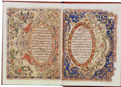
Gambar 2. Manuskrip Hukum Kanun Pahang.