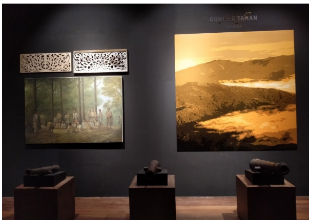
Gambar 4. Perjanjian Sungai Salan, Perjanjian Pembesar Melayu Pahang melawan penjajah British