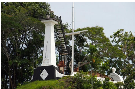
Gambar 4. Tiang Bendera

Selain itu, pembinaan tiang bendera di atas Bukit Puteri berfungsi sebagai rujukan kepada para pedagang yang menjalankan kegiatan perdagangan di persisiran Sungai Terengganu pada pemerintahan Sultan Zainal Abidin I (Portal Rasmi Arkib Negara Malaysia, 2018). Gambar 4 di bawah menunjukkan tiang bendera di atas Bukit Puteri.