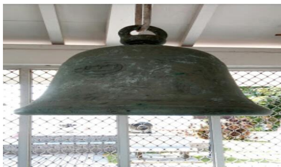
Gambar 2. Rumah Genta dan Genta