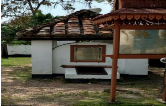
Gambar 5. Lubang simpan peluru bedil

5 di bawah menunjukkan tempat penyimpanan peluru bedil di atas Bukit Puteri.