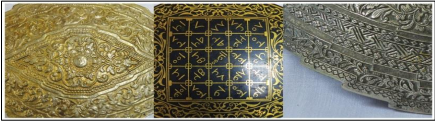
Rajah 4. Motif flora, kaligrafi, fauna dan geometri sebagai reka corak pada pending Melayu