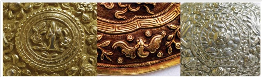
Rajah 5. Motif figura, geometri, fauna dan flora pada pending Baba Nyonya.