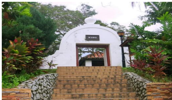
Gambar 6. Kubu pertahanan dibina di atas Bukit Puteri