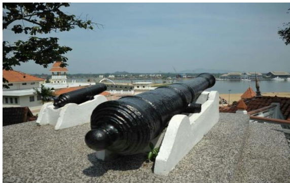
Gambar 3. Meriam Beranak

Oleh itu, keunikan meriam dalam pelbagai saiz dan bentuk ini sebagai peninggalan artifak bersejarah masih dikekalkan dan dipelihara di atas puncak Bukit Puteri sehingga zaman kini dikenali sebagai meriam beranak yang mempunyai saiz berbeza tetapi mempunyai rupa bentuk yang sama. Kedua-dua meriam ini diletakkan berhampiran untuk membezakan bahawa meriam kecil adalah anak kepada meriam besar yang dikenali sebagai meriam beranak. (Azuan, 2018).