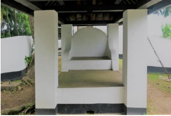
Gambar 7. Kubu Lama di Atas Bukit Puteri dan Singgasana Sultan