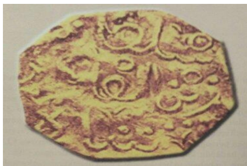
Gambar 1. Kupang Emas Terengganu (Anwar & Nik Anuar, 2011)

Berdasarkan petikan di atas, penggunaan mata wang syiling di Terengganu juga dibuktikan dalam catatan Abdullah Munshi yang berada di Terengganu pada tahun 1836 menyatakan kupang syiling yang digunakan oleh masyarakat awal di Terengganu dan pedagang luar adalah dikenali sebagai ‘Malikul Adil’. Malikul Adil adalah “nilai setiap kupang syiling yang dicatatkan oleh beliau adalah “Syahadan maka adalah wang belanja Negeri Terengganu itu tiga ribu delapan ratus empat puluh pitis timah yang termeterai di dalamnya Malikul Adil dipakai satu ringgit. Maka besarnya pitis itu seperti satu duit kita (dollar Selat) juga adanya.” (Norizan, 1990). Berdasarkan petikan ini dapat dikaitkan bahawa Bukit Puteri dikenali sebagai tempat rujukan sebagai pusat kegiatan perdagangan yang berhampiran dengan Sungai Terengganu semasa pemerintahan Sultan Zainal Abidin Shah I. Sejarah Terengganu telah membuktikan bahawa kemasyhuran Bukit Puteri sebagai tapak warisan kebudayaan dan sejarah budaya masyarakat Melayu tempatan di Negeri Terengganu dari aspek pembangunan ekonomi bercorak tempatan.