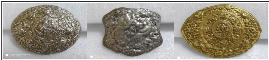
Rajah 2. Bentuk-bentuk pending Baba Nyonya