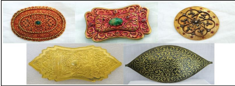
Rajah 1. Bentuk-bentuk pending Melayu