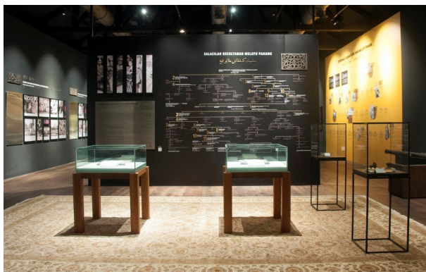
Gambar 3. Galeri Kesultanan Melayu Pahang - Daulat Tuanku di Muzium Sultan Abu Bakar, Pekan, Pahang