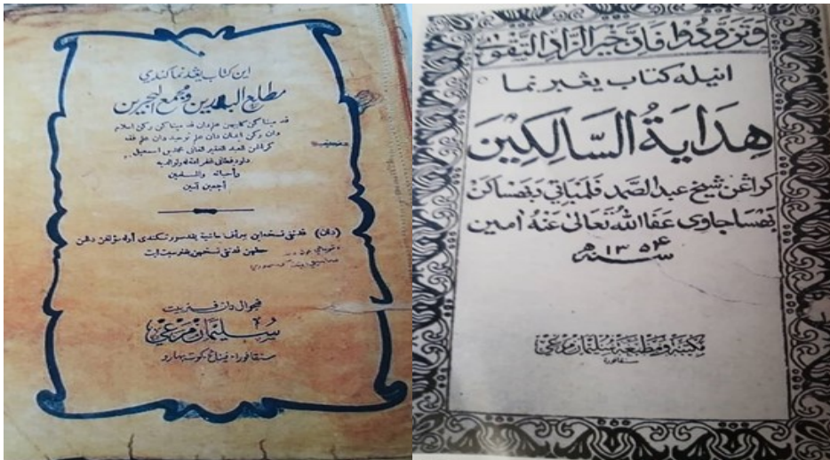
Rajah 1: Kitab Matla' al Badrin wa Majma' al-Bahrain dan Hidayatus-Salikin.

yang berasal daripada Sekolah al-Quran. Sekolah al-Quran dan Kitab yang merupakan institusi formal dalam pendidikan Islam bergabung dalam sebuah bangunan yang terdiri daripada kelas darjah satu hingga empat. Murid Sekolah Kitab menggunakan kaedah pembacaan beberapa buah kitab selain menghafaz Muqadam, membaca Quran dengan hukum tajwid secara berperingkat dan mempelajari bacaan dan mengalunkan kitab Berzanji. Antara kitab terkenal yang digunakan oleh generasi pertama sebelum merdeka ialah Matla' al Badrin wa Majma' al-Bahrain dan Hidayatus-Salikin (Kamdi Kamil, 2018).