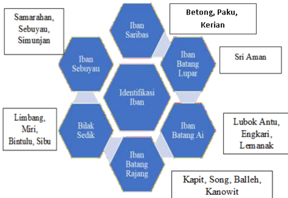
Rajah 2: Identifikasi Iban di Sarawak. (Diubahsuai dari temubual dengan Datuk Sri Edmond Langgu, 2019)

Selain itu, pengenalpastian identifikasi ras etnik Iban di Sarawak dapat dikenalpasti melalui beberapa aspek iaitu bahasa dan busana. Menurut informan Tugang Rima, terdapat perbezaan makna dan intonasi komunikasi di antara masyarakat Iban yang tinggal di Bahagian Sungai Rejang dan Batang Ai dengan masyarakat Iban yang menetap di Sungai Saribas. Intonasi suara masyarakat Iban Sungai Rejang (merujuk Kapit, Sibu, Kanowit dan Batang Ai) adalah lebih kasar dan keras berbanding dengan masyarakat Iban yang menetap di Sungai Saribas yang lembut dan perlahan rimanya. Faktor ini adalah kerana wujudnya wong ai (pusaran air besar) yang kuat sehingga mengeluarkan bunyi bising di Sungai Rejang menyebabkan masyarakat setempat harus menggunakan nada suara yang keras dan tinggi dalam berkomunikasi antara satu sama lain.