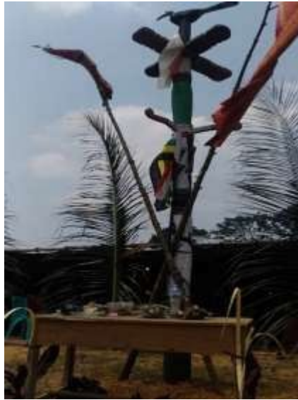
Rajah 4: Sandung Kenyalang

Simpi adalah di Sadap, Sumpak, Serian, dan Tunggak. Selain itu, bagi memperingati semula masa puncak kejayaan masyarakat Iban di Tembawai Tampun Juah terdahulu, masyarakat Iban dari Sarawak, Indonesia, Brunei dan Sabah telah mendirikan Sandung Kenyalang. Sandung Kenyalang (tiang kenyalang) adalah sebagai lambang kegemilangan dan kemegahan dalam kebudayaan Iban. Pada masa dahulu, apabila pahlawan-pahlawan Iban berhasrat untuk melakukan ekspedisi Ngayau , maka tiang kenyalang akan didirikan dengan mengadakan upacara Gawai Kenyalang selama tujuh hari tujuh malam. Tujuannya adalah sebagai lambang keberanian dan kekuasaan mereka di atas tanah Borneo.