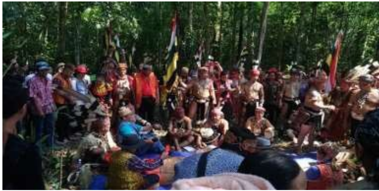
Rajah 5: Sambutan Gawai di Tembawai Tampun Juah